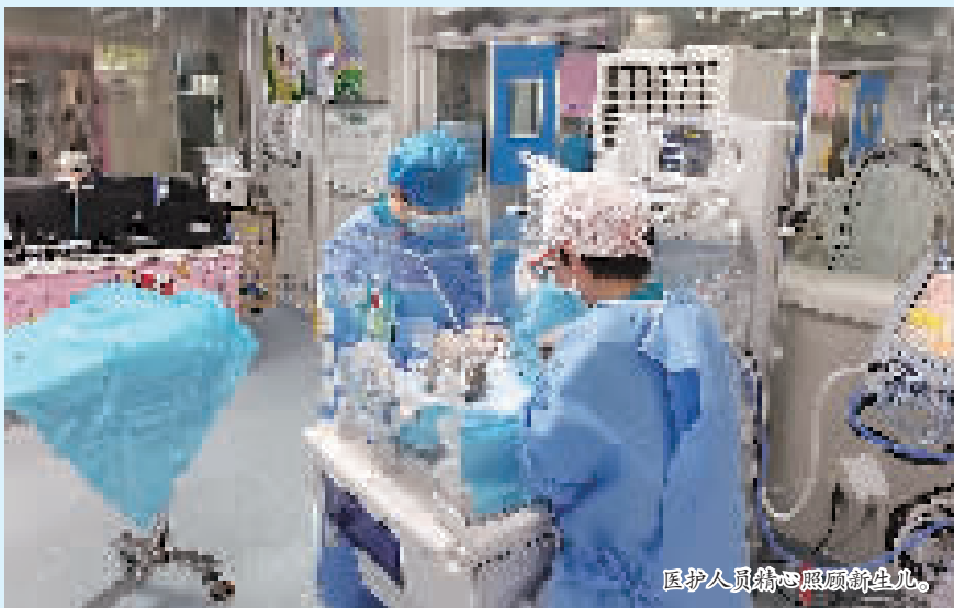
医护人员精心照顾新生儿。

本报讯(记者 李圣哲)昨天,两个“巴掌大”的小宝宝躺在沧州市人民医院新生儿科的暖箱里,享受着模拟宫内状态的最适合的温湿度舒适环境,睡得很香甜。这对龙凤姐弟刚出生两天,弟弟体重720克,姐姐仅重420克。据介绍,420克打破了市人民医院乃至全省医院收治早产儿的最低出生体重纪录。