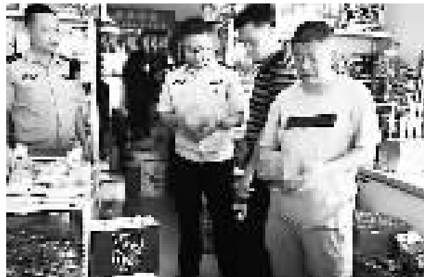
近日,泊头市公安局食品药品安全保卫大队开展节前食品市场大检查,查获假酒26箱。

面对查询结果,李某低下了头。他说,他觉得自己的驾驶技术不错,想拿客车“练练手”,没想到被民警发现。