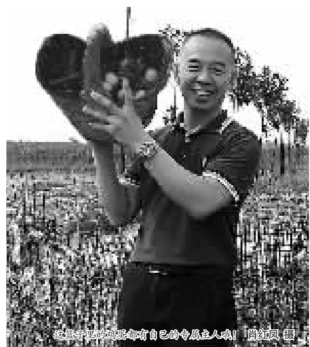
这颗守时的鸡蛋唯有自己的专属主人哦!