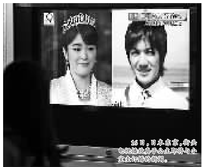
16日,日本皇室,御孙电视播放真子公主即将与小室圭订婚的新闻。

员结婚后应脱离皇籍,真子也不例外。届时,日本皇室成员将减少至18人,其中女性为13人。日本正就天皇退位研究立法,而就是否允许女性皇室成员婚后保留皇籍,设立“女性宫家”成为各界讨论焦点。日媒称,真子此时成婚会给相关讨论造成一定影响。