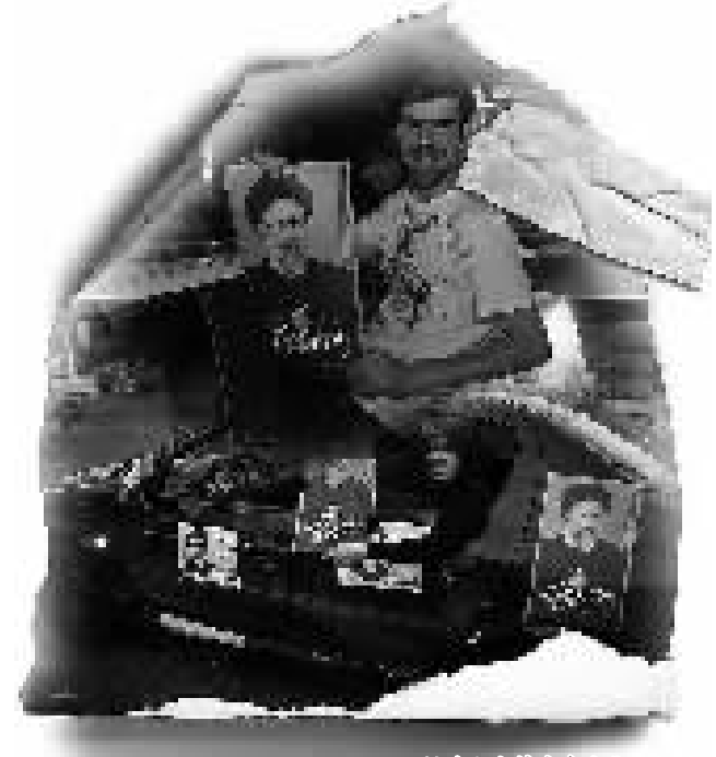
候选人支持者奔走街头拉票。

伊朗定于19日举行第12届总统选举。18日,德黑兰民众抓住投票前的最后机会走上街头,散发传单、呼喊口号,为支持的总统候选人拉票。