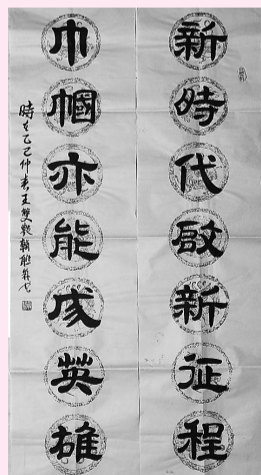
书法 王双艳 作