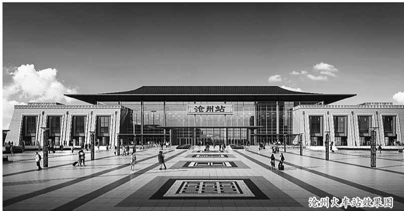
沧州火车站效果图