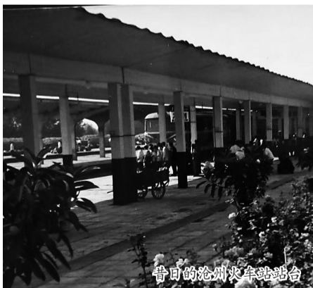
昔日的沧州火车站站台