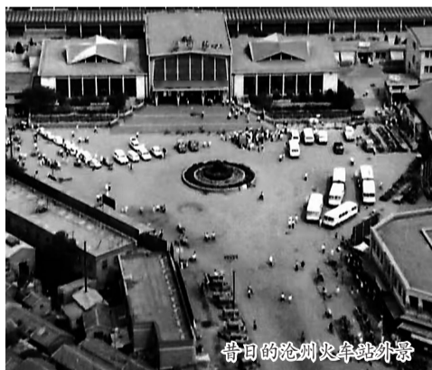
昔日的沧州火车站外景