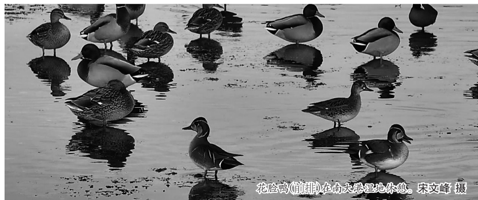
花脸鸭(前排)在南大港湿地休憩。

据悉,花脸鸭又名巴鸭、黑眶鸭、眼镜鸭,在鸭科鸟类中颇具辨识度,以其独特的面部花纹而得名。花脸鸭雄鸟在繁殖季节,会展示出黑白相间、类似戏剧脸谱的面部图案,因此被称为鸟类世界中的“彩羽明星”。花脸鸭被列入世界自然保护联盟濒危物种红色名录。