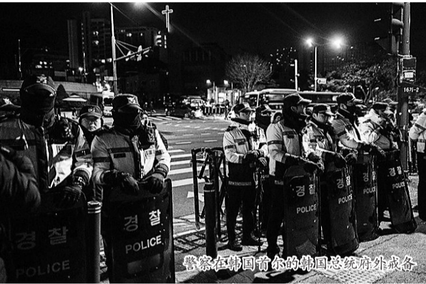
警察在韩国首尔的韩国总统府外戒备