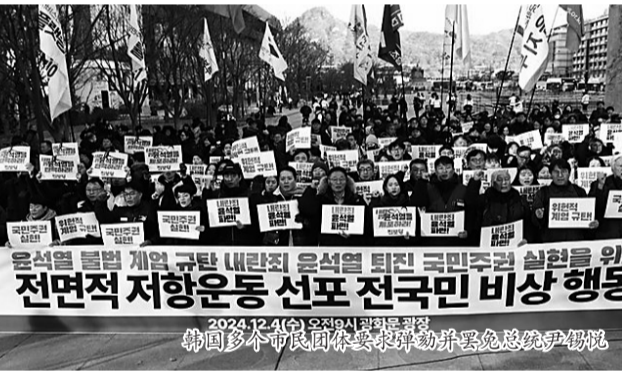
韩国多个市民团体要求弹劾并罢免总统尹锡悦