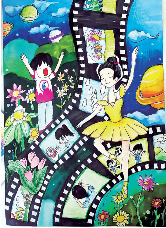
记录美好生活(绘画)