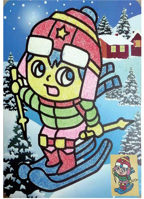
冬雪的快乐(沙画制作)