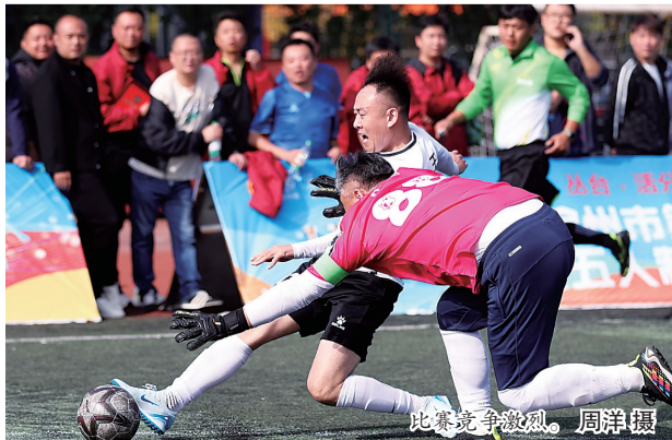
比赛竞争激烈。

市总工会相关负责人表示,沧州市职工五人制足球比赛设立以来,得到了全市广大足球爱好者的支持。这次比赛,为全市足球爱好者提供了交流学习的平台,营造了足球运动的良好氛围,推动了全民健身的开展。