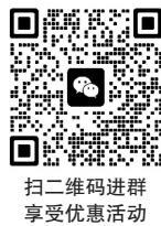
扫二维码进群 享受优惠活动

地址：沧州市运河区浮阳南大道新闻大厦门口北第三个门市 沧州日报社·全媒体融合发展交流中心 乘坐1路、138路、29路、158路公交车即到 营业时间：上午8:30-12:00 下午2:00-5:30 咨询电话：17778879182、19933419614