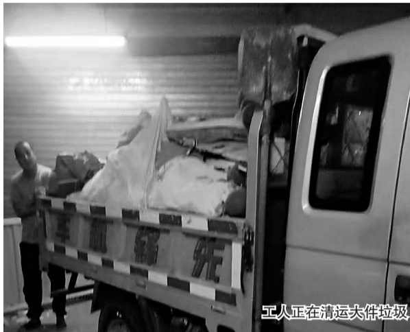
工人正在清运大件垃圾

色围挡围起来,里面放着旧床垫、马桶、桌子等大件物品。物业工作人员告诉记者,每隔一段时间,工作人员会将这里的垃圾清运到沧州市生活垃圾分类分