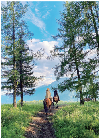
影秀。黄昏中,一头老黄牛慢慢踱步在被染成黄色的小路上。南瓜开着黄花,向日葵擎着硕大的金盘……

我拉着她的小手,不停地赞美着。她随即挣脱了我的手,又欢快地吹起了泡泡。其实,我还想告诉她,她指甲上的桃红也开到了我的心田里,美美的,暖暖的。