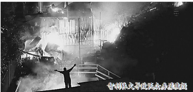
智利林火造成137人丧命

当地时间5月25日,智利媒体援引警方消息报道,警方逮捕了涉嫌今年2月在智利中部旅游胜地比尼亚德尔马引燃森林大火的两名嫌疑人。酿成137人丧命惨剧的竟是一名消防员和一名林业官员。