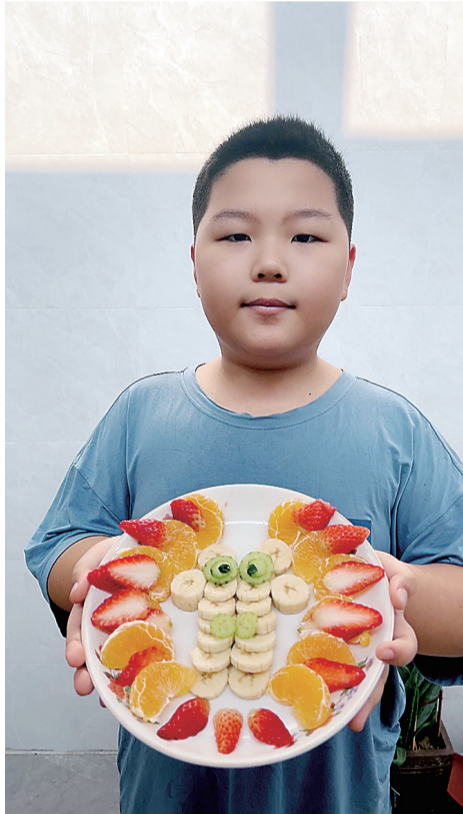
祥龙彩云(水果拼盘)