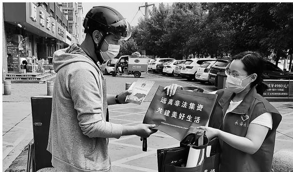
近日,运河区永安社区开展打击非法集资宣传活动。志愿者发放宣传材料,引导市民远离非法集资,提高防范意识。

刘世凯及刘丹彤团队通过精细解剖分离,将彭女士盆腔内肿物全部取出,并切除子宫这个“罪魁祸首”。紧接着,血管外科张磊团队完成腔静脉内肿物切除。最后,心胸外科周继梧及张楠团队为彭女士建立体外循环后,小心翼翼地切开她的心脏,取出右侧心房内肿物。9个小时后,彭女士体内的肿瘤终于被全部取出。目前,彭女士已顺利出院。