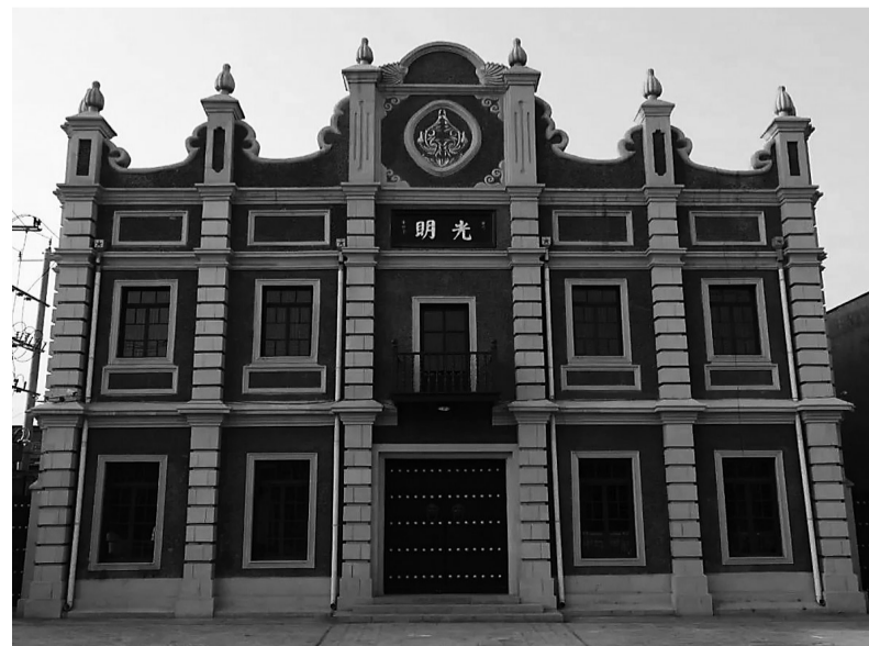
修缮后的光明戏院

关上戏院的大门，仿佛走过了一个世纪。这座建筑在岁月的长河中默默承载着历史的重量，它不仅是一座文物，更是一段弥足珍贵的历史。