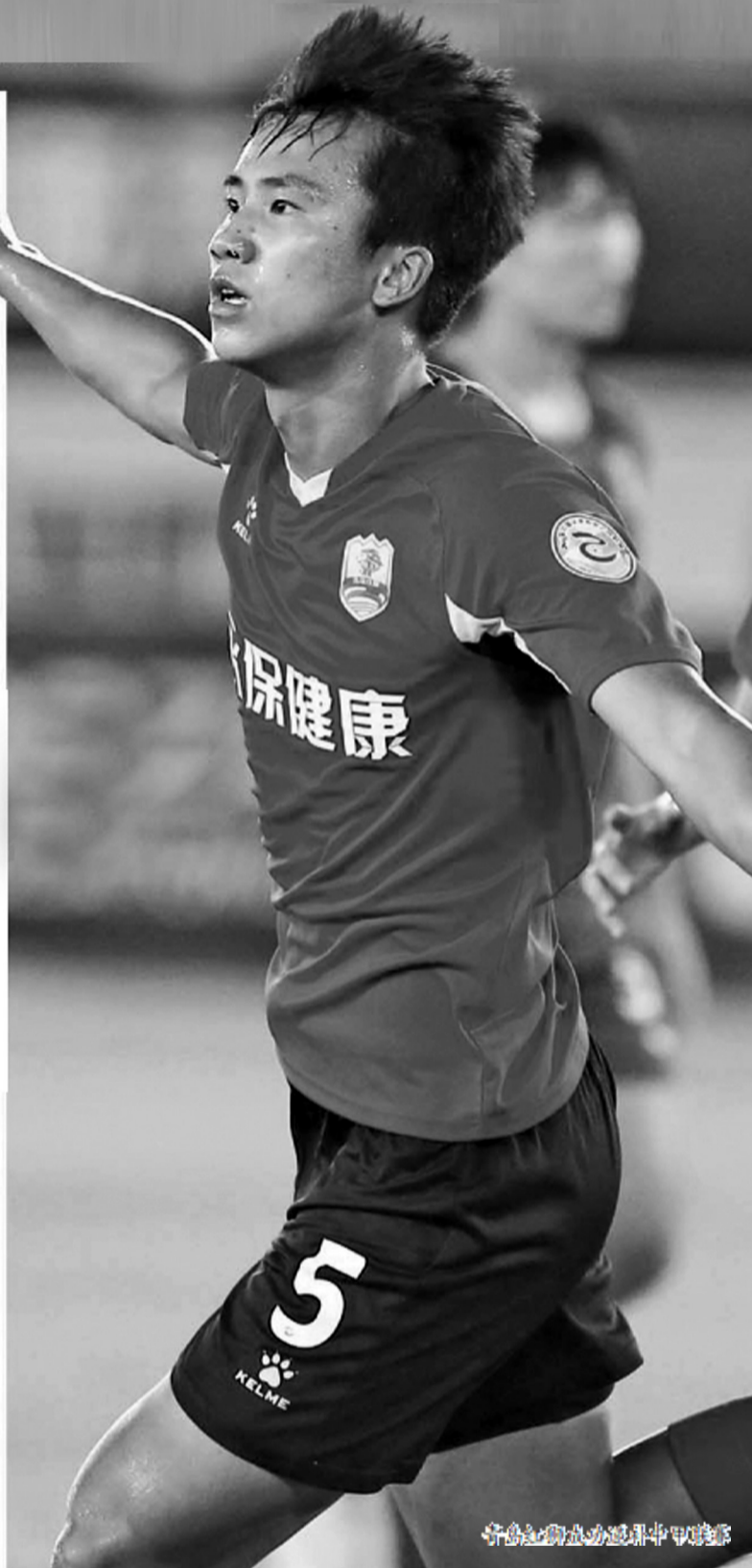
青岛红狮递补中甲联赛