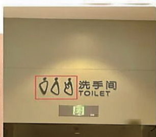
这是洗手间标志? 差点以为是耳环, 有毒的设计

实用性 VS 设计感,该如何兼顾?有网友指出,公共卫生间,简单用男女两个字区分为什么不行?有不同观点认为:图形化标志有其优势,设计者追求创意和美学表达的想法值得肯定;部分设计奢华漂亮的公共卫生间成为了网红打卡地,而性别标志也成为其整体设计的一部分。