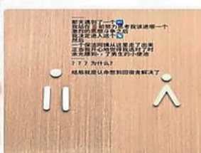
这是洗手间标志? 差点以为是耳环, 有毒的设计