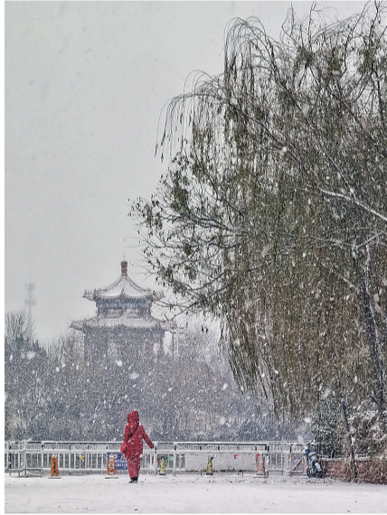
一抹红妆醉南湖(摄影)