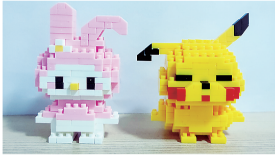
可爱的小动物(手工作品)