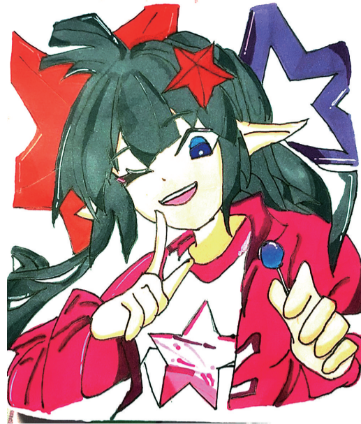
动漫人物凯莉(绘画)