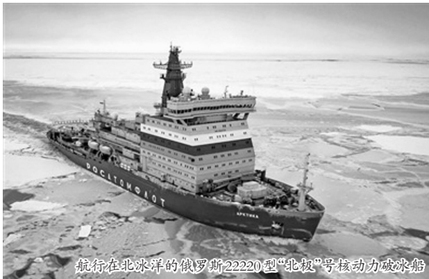
航行在北冰洋的俄罗斯22220型“北极”号核动力破冰船

可以更为便捷地前出北极地区。需要重点关注的是,最新签署的美芬防务合作协议并未对核武器作出任何限制,这给北极地区未来可能出现的核对抗埋下了