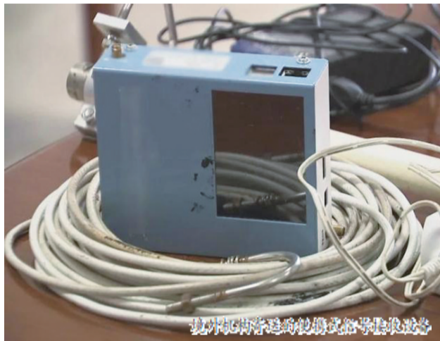
境外机构精准招募“志愿者”非法获取我国飞行器数据

送大小接近普通智能手机的便携式信号接收设备,并远程指导“志愿者”在我国境内航空枢纽附近投放,以实现对其周边一定范围内飞机的型号、高度、经度、纬度、速度、航向等信息的自动采集,并将上述数据实时传输到境外机构指定的服务器