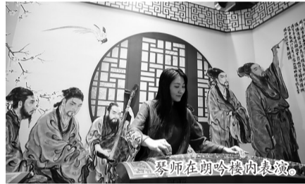
琴师在朗吟楼内表演。

抱厦，重檐攒尖顶，雕梁画栋，飞檐翘角，沥粉贴金。楼内一层为历史文化展厅，二层为盐业文化主题展，三、四层为南川茶楼，五层可以登高观景。