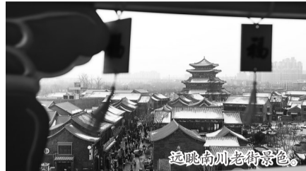
远眺南川老街景色。