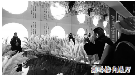
琴师在朗吟楼内表演。