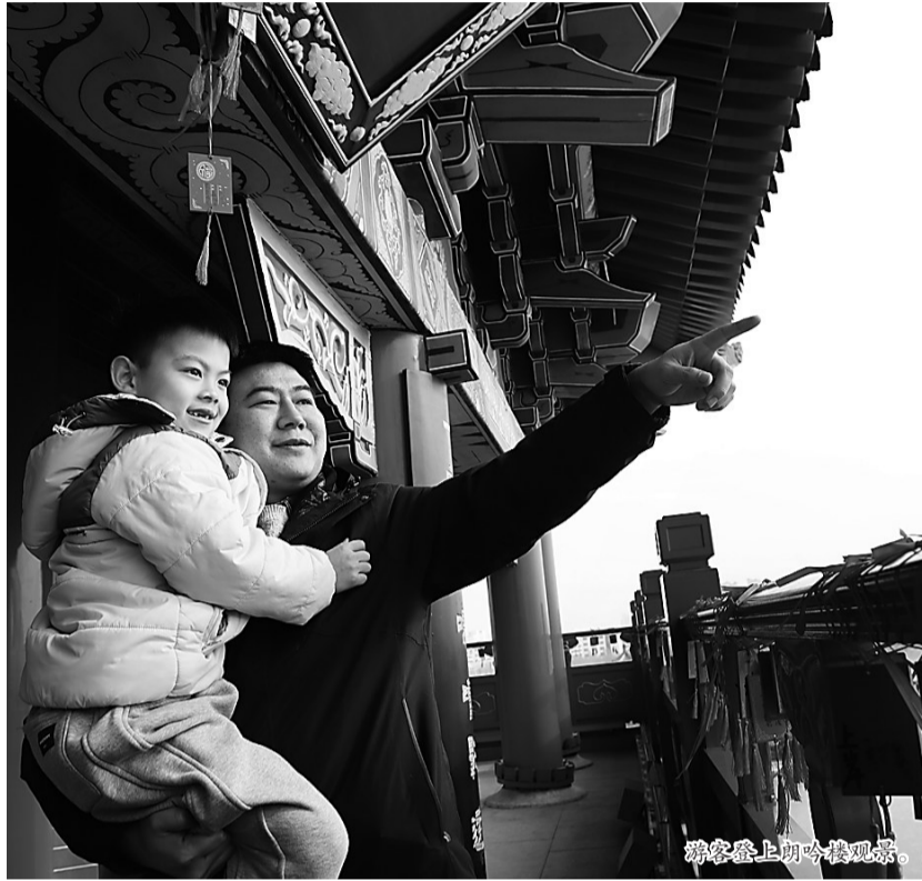
游客登上朗吟楼观景。

南川楼坐落于南川古渡口东岸，整体楼高34.37米，单体建筑面积4793.89平方米，四面出