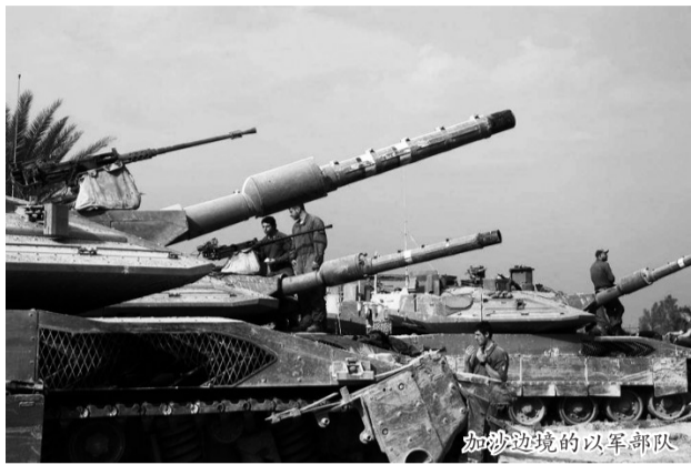
加沙边境的以军部队

对于2024年欧洲国家在俄乌问题上的态度,郭宪纲认为,“欧洲(国家)可能会调整‘追随美国,制裁俄罗斯’的政策,和俄罗斯恢复经济往来,特别是能源方面的合作,因为这符合欧洲的利益。”