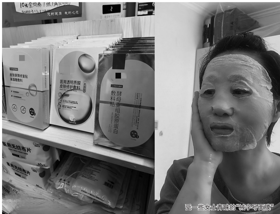
受一些女士青睐的“械字号面膜”

不少美妆视频博主会推荐使用“械字号面膜”护肤,记者打开一个点赞高达3万多的视频看到,博主在视频里拿着一款面膜介绍其使用效果,并强调面膜的产品注册证编号为械字号,不同于普通的妆字号面膜,声称“械字号面膜”护肤效果更加明显且安全。