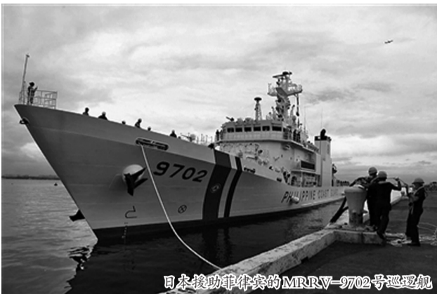
日本援助菲律宾的MRRV-9702号巡逻舰

日本并不是第一次向菲律宾提供武器装备。2017年,日本修订《自卫队法》,允许将自卫队的二手装备免费或低价转让给其他国家。此后,日本分批次无偿向菲律宾提供了12艘巡逻舰。菲律宾也从印度、韩国等采