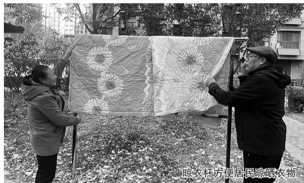
晾衣杆方便居民晾晒衣物

本报讯(记者 崔春梅 通讯员 吴胜国)近日,沧州高新区东区管理服务中心在紫御华府、弘仁里、天成和园等小区设置公共晾晒区并安装12组晾衣杆,方便居民晾晒衣物。