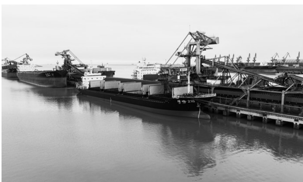
11月25日,船舶在黄骅港装载电煤(无人机照片)。近日,黄骅港启动冬季电煤