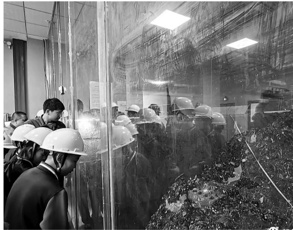
近日,盐山县边务镇新时代文明实践所组织20多名学生来到中节能(盐山)环保能源有限公司,参观生活垃圾“大变身”过程,学习环保知识。