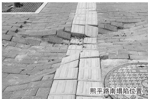
熙平路南塌陷位置