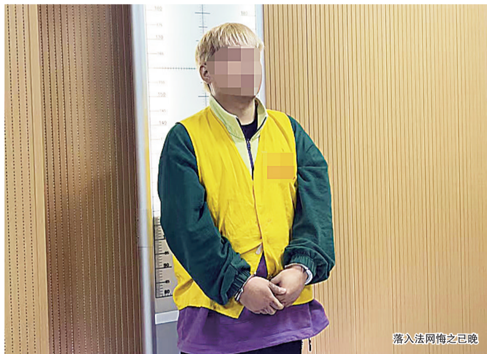
落入法网悔之已晚