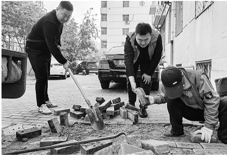
“能工巧匠服务队”的志愿者多是退休老党员。他们的无私付出为大家树立了好榜