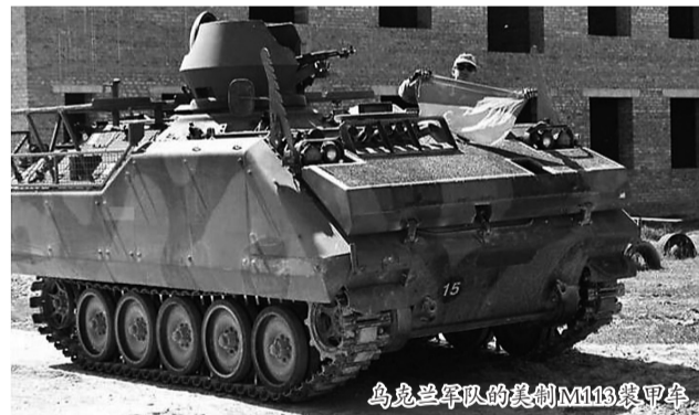
乌克兰军队的莫制M113装甲车

这批瑞士制造的弹药只是乌克兰通过第三方渠道购买的国防物资中的一部分。其他军火包括原属比利时的50辆M113B装甲运兵车,这些车辆已在冲突前线出现。装甲车的销售分散在50多份进口文件中,由美国“全