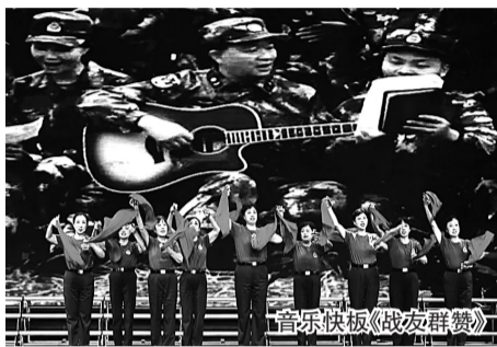
音乐快板《战友群赞》