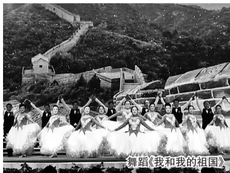
舞蹈《我和我的祖国》