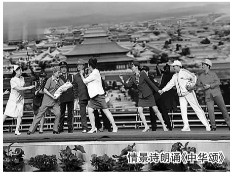
情景诗朗诵《中华颂》