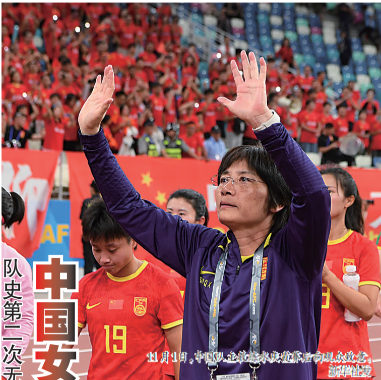
队史第二次无缘奥运会