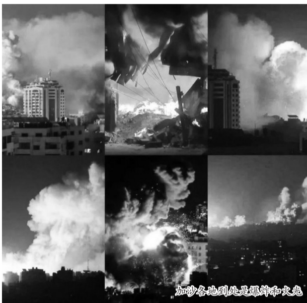
加沙各地到处是爆炸和火光

真实数据肯定超过了1万人。别忘了,以色列方面1400死者中,包括300多以军士兵;加沙方面7700死者中,不包括进入以色列发动袭击的哈马斯武装分子。