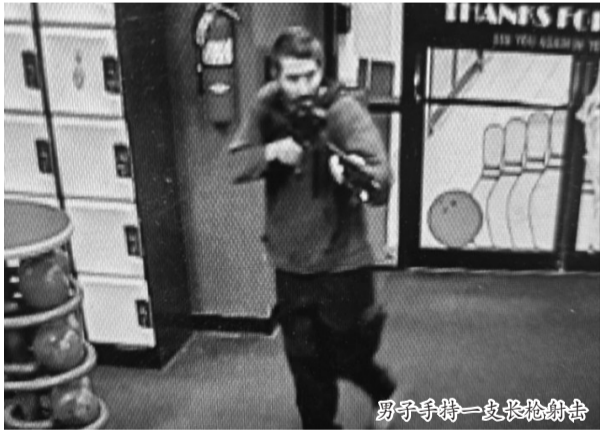
男子手持一支长枪射击

当地时间10月25日,一名持枪男子在美国缅因州刘易斯顿市一家酒吧和一个保龄球馆开枪,打死至少22人,另有数十人受伤。枪手目前在逃。