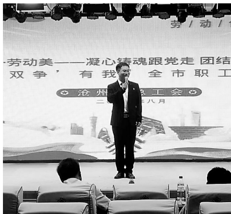
8月25日,沧州市总工会举办了“‘双争’有我”全市职工宣讲比赛。参赛选手来自29个单位的不同岗位。大家在宣讲中动情地讲述了自己的职业故事。

值得注意的是,有人也因为在网上买笑话而受骗。记者采访了解到,市民吴女士在网上看到有人收费讲笑话后,便加了对方的微信。吴女士发给对方9.9元钱后,对方不仅没讲笑话,反而告诉她“花钱买个教训”,转而把她拉黑了。