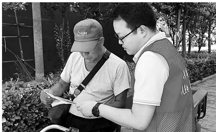
日前，新华区建新街社区志愿者来到金城瑞景小区，向居民宣传防范电信诈骗网络诈骗知识。

刘震提醒市民，一旦发现颈部、腋下或者皮肤褶皱部位出现了明显的颜色加深，要及时去医院就诊。