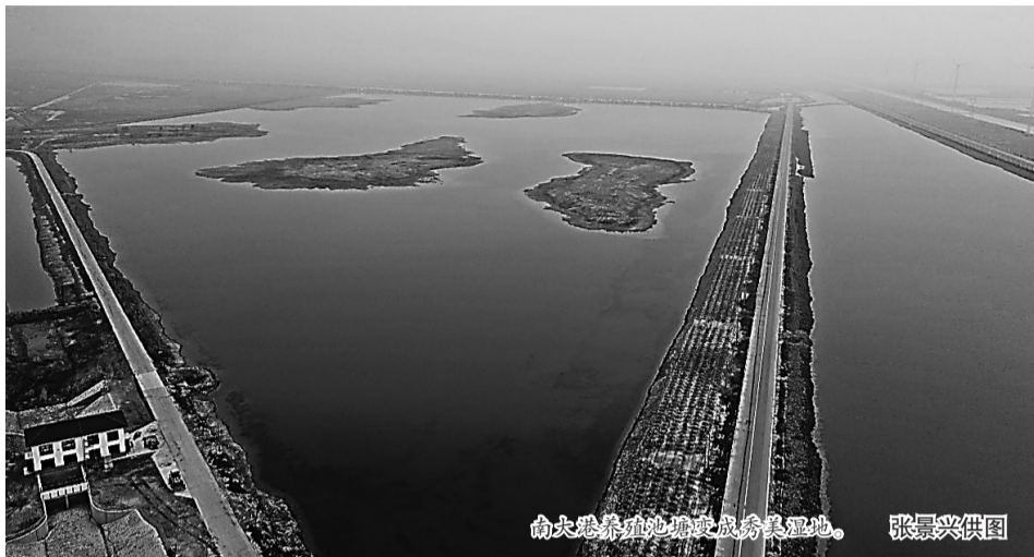
南大港养殖池塘变成秀美湿地。

本报讯(记者 张倩 鹿维双 何晓玲)盛夏时节,南大港湿地生态修复区内,水草丰美、候鸟翔集。谁也想不到,3年前,这里还是一片环境恶劣的池塘。南大港湿地和鸟类自然保护区大力实施生态修复项目,通过不懈努力,最终使这里呈现出一派生机勃勃的景象。