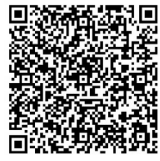
扫码了解更多公证知识

一方死亡，随着姻亲关系的结束，另一方也就丧失了法定继承权，但我国立法上鼓励丧偶儿媳对公婆承担赡养义务，规定在其尽了主要赡养义务的情况下，可以作为第一顺序继承人继承公婆的遗产，其他任何人不得剥夺这种权利，且丧偶儿媳的继承权不影响其子女的代位继承权。