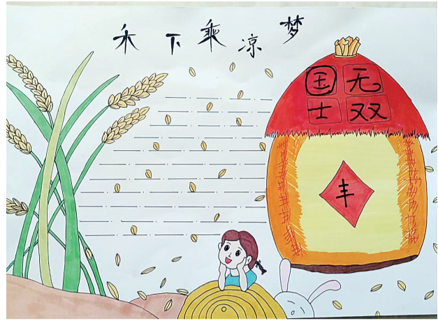
禾下乘凉梦 (儿童画)