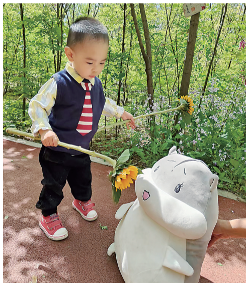
我给弟弟拍张照 (摄影)