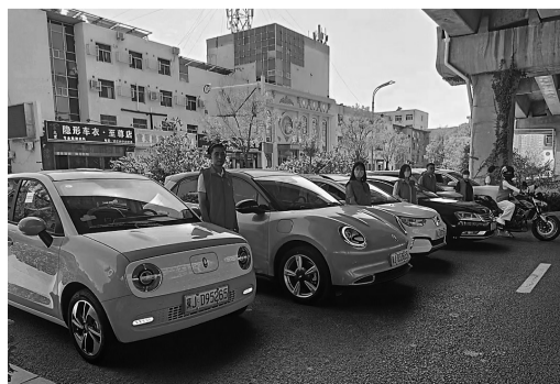
近日, 沧州市新华区祁孟庄社区组织党员群众成立“爱心助考”志愿服务队, 为莘莘学子提供免费送考服务。

何伟提醒市民, 如果异物进入耳道的位置比较深, 一定要去医院就诊, 切忌自行掏挖损伤耳膜。