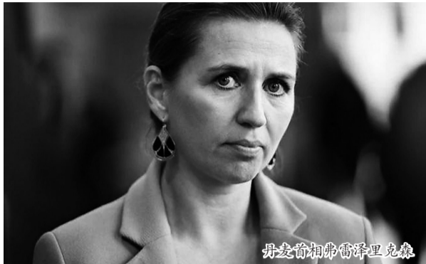
丹麦首相弗雷泽里克森

近日,丹麦首相梅特·弗雷泽里克森在议会演讲时透露,她的演讲稿一部分是用时下最火的AI(人工智能)软件ChatGPT撰写的。