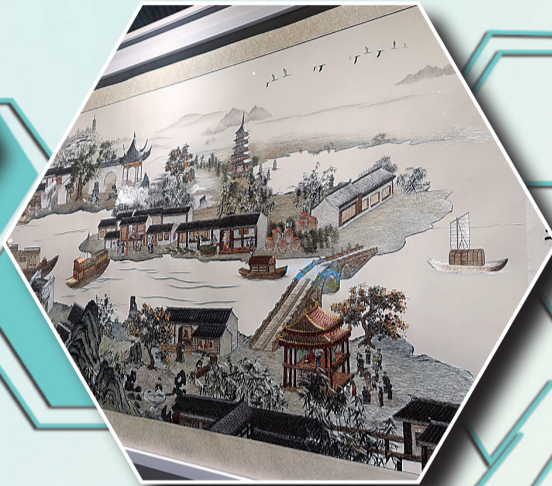
苏绣作品《千里运河非遗大观长卷》