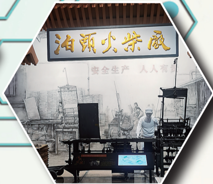
老泊头火柴厂的设备展示