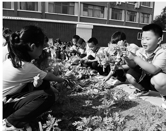
近日, 在沧州经济开发区中心学校劳动教育种植基地的田间课堂上, 孩子们兴奋地收获成熟的蔬菜。