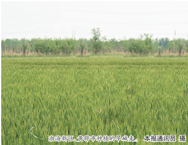
渤海新区、黄骅市种植的早碱麦。

岁,对于在盐碱地上耕作有深刻的体会。有的土地盐碱相当严重,只长黄菜、碱蓬、芦苇。有些土地盐碱不那么严重,长的农作物产量也相当低。而且,这里的土地不能浇水,水浇后容易返碱,来年就没法耕种了。