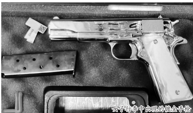
女子行李中出现的镀金手枪

据报道,一名28岁的美国女子23日从洛杉矶飞抵澳大利亚悉尼,海关在其行李中发现一把24K镀金手枪,该女子随即被警方逮捕。