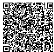
扫码了解更多公证知识

录”留证,即同步录音、录像,将取证方式由传统物理“面对面”向远程视频“面对面”转变,最大程度实现“马上办、网上办、就近办、一次办”。此项公证服务方式的转变,有助于打破传统空间限制,也让身处各地的当事人都能切身感受到“互联网+”公证带来的便利,从而为群众提供更高效便捷的公证服务。