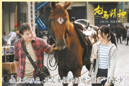
赤兔的陪伴,让父女俩的情感纽带不再脆弱